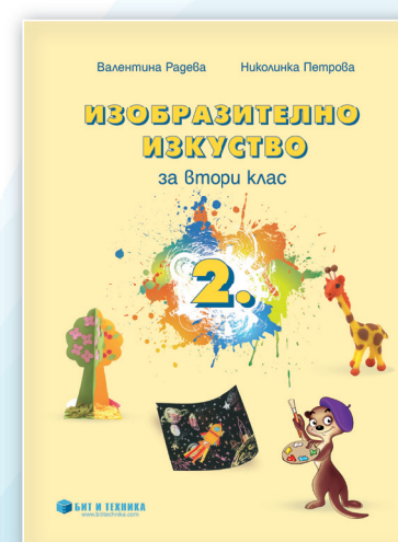
Автори: гл. ас. д-р Валентина Рагева Николинка Петрова