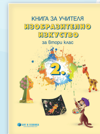
Автор гл. ас. д-р Валентина Рагева

Издателство БИТ И ТЕХНИКА е сертифицирано по международен стандарт за качество ISO 9001